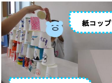
ピンポン玉で崩す!